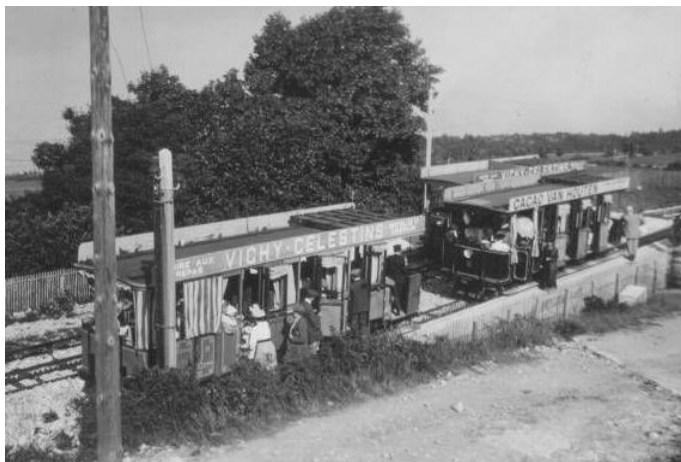
Postkarte mit Triebwagen aus zwei Farbepochen ca. 1910 in der Bergstation Treize-Arbres.

Die vergessene erste elektrische Zahnradbahn der Welt, auf den Hausberg von Genf.