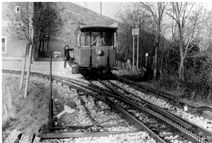
Foto eines Triebwagens in Monnetier-Mairie. Gut sichtbar ist die Schrommschiene und die Abt Zahnstange.

Zu Beginn war die Salève-Bahn hoch rentabel. Nach dem ersten Weltkrieg, auch infolge des aufkommenden Automobilverkehrs, erlebte die Zahnradbahn weniger rosige Zeiten. Mit der Eröffnung der konkurrierenden Luftseilbahn Veyrier – Treize-Arbres im Jahre 1932 war das Ende der nun veralteten, zu langsamen Zahnradbahn besiegelt. 1937 wurde der Betrieb auf dem letzten Teilstück eingestellt, nachdem bereits im Winter 1931/1932 die Dörfer im Streckenabschnitt Étrembières – Mornex – Monnetier-Mairie durch einen Autobusbetrieb erschlossen wurden. Bereits 1938 war die gesamte Strecke abgebrochen.